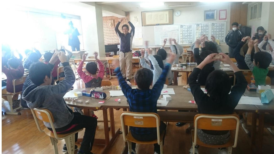
「花まる学習会」との連携授業