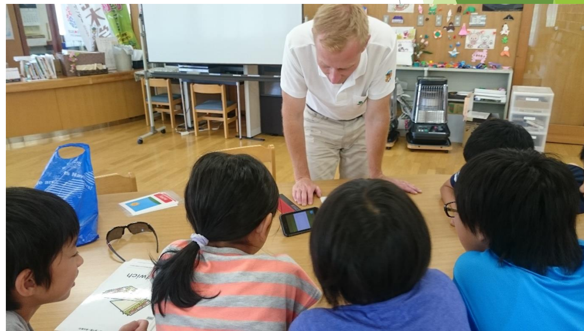
小学1年生から英語の授業